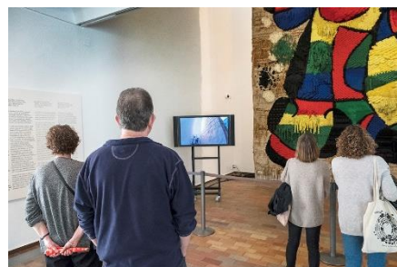
Tasques de conservació preventiva del Tapís de la Fundació . 8-11 de març de 2019. © Fundació Joan Miró. Fotos: Oriol Clavera