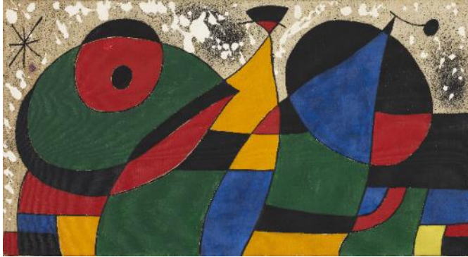
Joan Miró: Maqueta del Tapís del World Trade Center , 1972. Fundació Joan Miró, Barcelona

tècnics del tapisser tarragoní van ser determinants perquè Miró es pogués expressar amb la radicalitat que anhelava i així escriure una de les pàgines més insòlites de tota la història de l'art tèxtil.