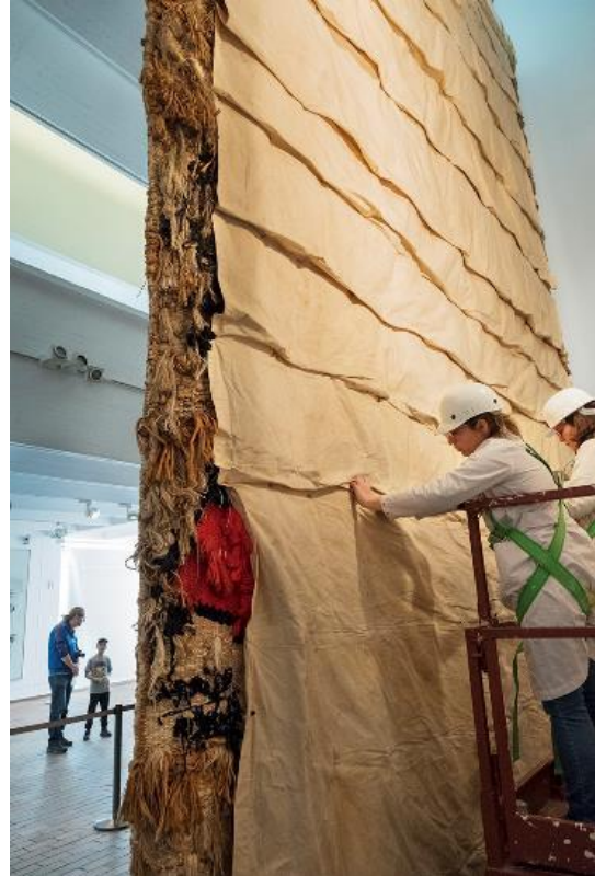
Tasques de conservació preventiva del Tapís de la Fundació . 8-11 de març de 2019.

Aquesta operació excepcional ha requerit un projecte específic de l'equip de la Fundació Joan Miró en molts àmbits. En el capítol de mecenatge, i amb el suport de Majestic Hotel & Spa Barcelona, la Fundació va oferir el setembre de 2018 un sopar filantròpic al Pati nord la recaptació del qual ha fet possible aquests treballs.