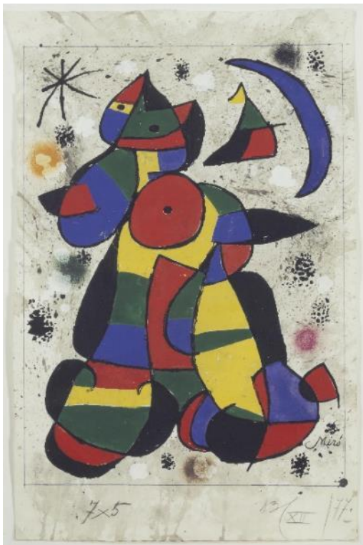
Joan Miró. Maqueta del Tapís de la Fundació , 1979. Fundació Joan Miró, Barcelona. Donació de Josep Royo Peña

El 1970, amb la col·laboració de Royo, Miró fa la seva primera obra tèxtil, el Tapís de Tarragona , a la qual el 1972 s'afegirien els sobreteixims, a mig camí entre la pintura, el collage i la tapisseria. Uns anys més tard, arran de l'encàrrec d'uns tapissos monumentals per a Nova York i Washington —el gran Tapís del World Trade Center (1974) i el Tapís de la National Gallery de Washington (1977)—, Miró en projecta un per a la Fundació. Al teler de la Farinera també s'hi teixeixen el Tapís de la Fundació "La Caixa" (1980) i el Tapís de la Fondation Maeght (1980), que completen aquesta sèrie de cinc tapissos monumentals.