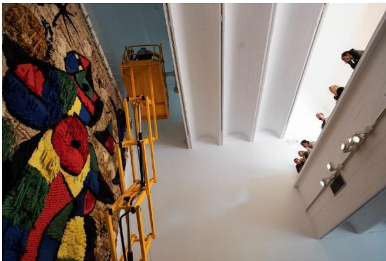
Desplaçament frontal del Tapís . 21 de febrer de 2019. © Fundació Joan Miró. Fotos: Oriol Clavera