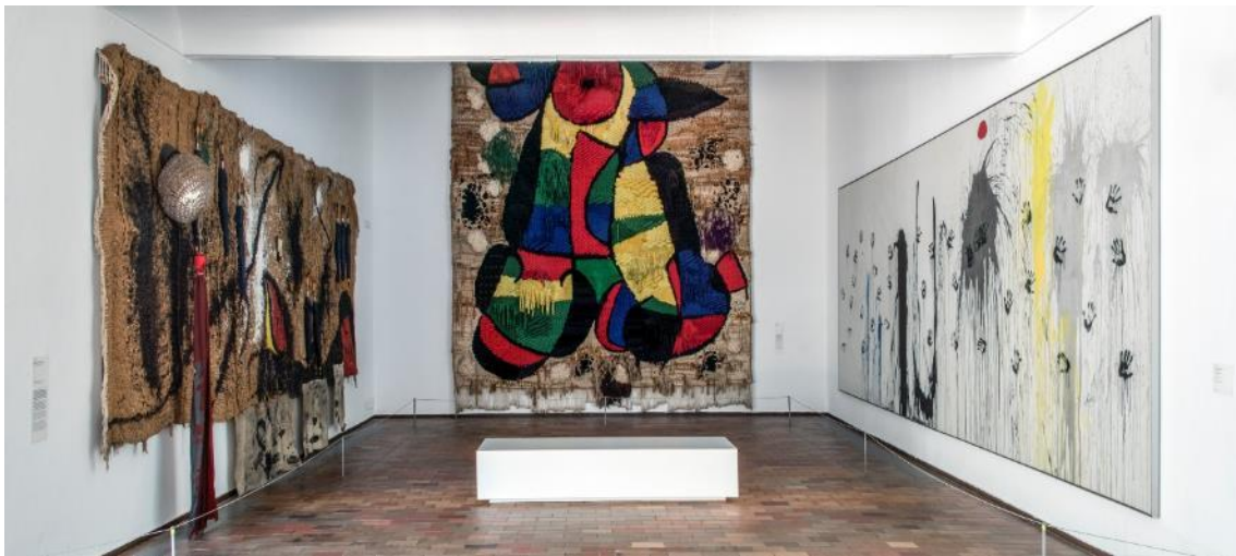
Sobreteixim dels vuit paraigües , 1973 i Mans volant cap a les constel·lacions (1974), al costat del Tapís de la Fundació Joan Miró , 1979. Presentació abans dels treballs sobre el Tapís .

El procediment de restauració del dors del Tapís ha comportat traslladar les dues obres que el flanquejaven. D'una banda, Mans volant cap a les constel·lacions (1974), una pintura de grans dimensions que comparteix amb el Tapís la seva vocació mural i que ara s'exposa just al seu davant. I de l'altra, el Sobreteixim dels vuit paraigües (1973), una altra obra tèxtil nascuda de la col·laboració amb Royo, la imatge predominant de la qual, a diferència del tapís ordinari, no prové del fons tèxtil sinó dels objectes que hi sobresurten. Aquesta darrera peça s'ha traslladat a la sala 9 de la col·lecció i s'exhibeix al costat de dues teles cremades amb les quals comparteix el caràcter antipictòric i la radicalitat expressiva de la darrera etapa de l'artista.