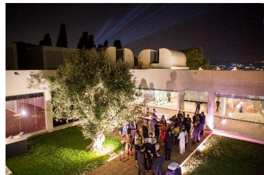
Sopar Miró . Fundació Joan Miró i Majestic Hotel & Spa Barcelona. Acte filantròpic en suport dels treballs de conservació preventiva del Tapís . 27 de setembre de 2018.