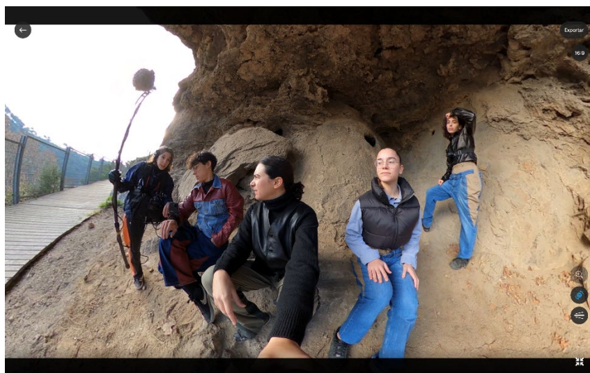
Bandolerismes , de Claudia Pagès. Cortesia de l'artista

El trabajo de Claudia Pagès aborda el texto y sus sustratos materiales desde distintos medios, como la escritura, la performance, el vídeo o la instalación. Pagès extrae elementos del lenguaje y los lleva al terreno visual para contestar problemáticas atravesadas por la lectura. Recientemente ha centrado su investigación artística en el gerundio. Para la artista, esta forma verbal empleada profusamente en la redacción de textos policiales y legales, así como en protocolos que rigen la logística internacional, tiene efectos directos sobre los espacios y los cuerpos que se ven afectados por ellos.