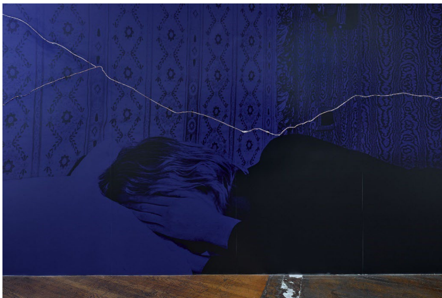
P. Staff, 2022.

P. Staff es poeta y artista y emplea distintos medios en su práctica visual como el vídeo, el collage, la instalación o el texto. Sus proyectos exploran las maneras en las que la historia, la tecnología, el capitalismo y la ley transforman la constitución de los cuerpos, prestando especial atención al género, la crisis ecológica, la enfermedad y la biopolítica. Le interesa la lectura como canal de violencia, pero también como potencial de resistencia, especialmente en relación con la intimidad, con lo abyecto y con los efectos físicos de la lectura.