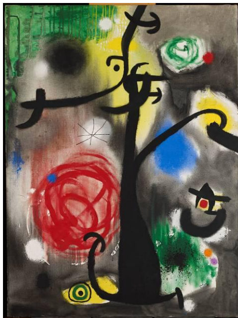
Femme et oiseaux dans la nuit. Joan Miró, 1968

Museu Nacional de Belles Arts de Taiwan (Taichung): 18/01/2014 – 27/04/2014