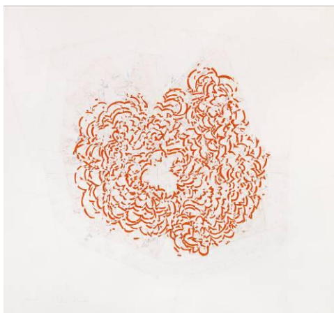
Roni Horn If 6, 2012

Seguiu l'exposició amb l'etiqueta #RoniHorn