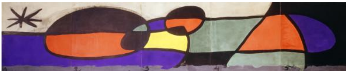
Joan Miró Maqueta del Mural de ceràmica de l'aeroport de Barcelona, 1970 Guaix damunt paper 99,8 x 499,7 cm Fundació Joan Miró, Barcelona

Amb la voluntat de seguir aprofundint en el seu fons, la Fundació Joan Miró prepara una exposició que analitza la transcendència de l'obra de Miró en l'espai públic. A partir dels esbossos, els dibuixos preparatoris, les maquetes, les fotografies o els vídeos que formen part d'aquest fons es presenta l'obra de Miró destinada a aquests espais.