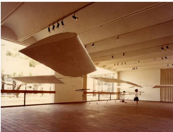
Espai 10: Panamarenko, maig 1984.

Des del seu naixement com a Centre d'Estudis d'Art Contemporani, la Fundació Joan Miró de Barcelona s'estableix com un focus generador de cultura contemporània des de la seva plataforma local. La programació de l'Espai 10,