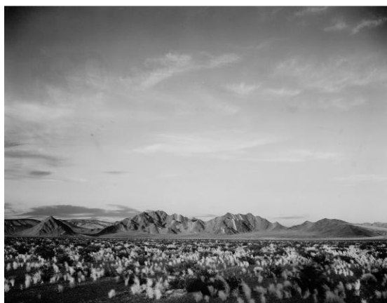
Ansel Adams Prop del parc nacional de la vall de la Mort (vista de les muntanyes a la llunyania, el desert, matolls ressaltats en primer pla) Cortesia de The U.S. National Archives i Records Administration

La tardor vinent la Fundació Joan Miró acull una exposició dedicada a l'horitzó com a element recurrent en la història de la pintura moderna des del segle XIX fins a l'actualitat. L'exposició vol posar de relleu el poder definidor de l'horitzó, indagar la seva enigmàtica dualitat, repassar la naturalesa canviant de la seva representació i reflexionar sobre el seu paper com a mirall paradoxal de les mutacions de la història i la cultura.