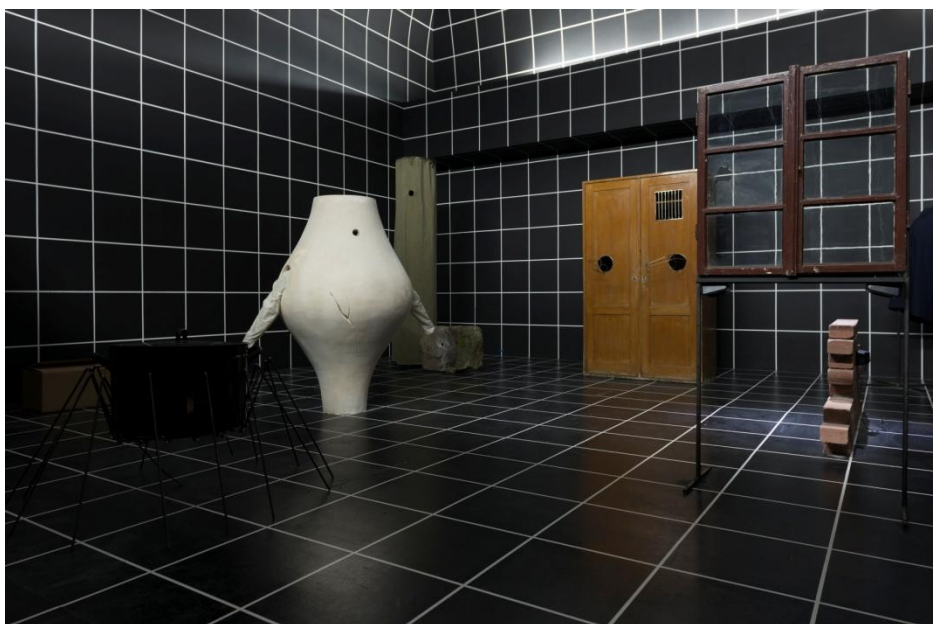
Eva Kotatkova, El teatre dels objectes , 2013

El naixement de l'objecte és el títol d'una fotografia del surrealista belga Paul Nougé, en la qual un grup de persones observa el buit com si hagués d'aparèixer alguna cosa en qualsevol moment. Eva Kotatkova manlleva el títol per al seu projecte, que reflexiona a l'entorn de la relació entre objectes i persones en un context institucional. L'artista se centra en objectes accessoris o mediadors –aquells objectes que generen una relació de seguretat o dependència com els nins per als nens, els objectes personals o heretats– i en objectes que ens limiten, ens guien o ens deformen –mobles perquè el nostre cos adopti una postura específica, roba que afecta la circulació o elements d'institucions que tracten de mantenir el control. A partir de tots aquests objectes, Kotatkova desplaça aquesta relació a l'esfera dels comportaments del públic en diverses institucions.