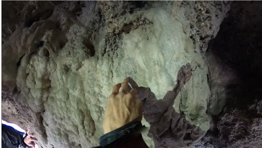
Bandolerismos , de Claudia Pagès.

Capellades, pueblo natal de la artista, adquirió en el siglo XVIII un gran prestigio en la producción de papel timbrado, que se usó principalmente para documentación judicial y administrativa y que sirvió como instrumento para la identificación, la legitimación, la colonización, la propiedad y el control. El vídeo que flanquea el muro está rodado en dos localizaciones de Capellades: el Museu Molí Paperer —que guarda un importante fondo patrimonial de papel timbrado— y el Abric Romaní del Capelló —yacimiento arqueológico neandertal que conserva marcas de distintas épocas grabadas sobre sus paredes de roca. En palabras de los comisarios, «tanto el museo como el barranco acumulan signos que se mueven en un espacio ambiguo entre la palabra y la imagen.»