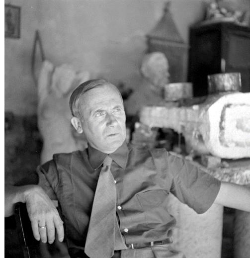
Joaquim Gomis. Retrat de Joan Miró 1944. Fons Joaquim Gomis, dipositat a l'Arxiu Nacional de Catalunya. © Hereus de Joaquim Gomis. Fundació Joan Miró, Barcelona, 2019

Imatges disponibles a http://bit.ly/UniversMiró