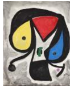
Joan Miró. Personnages et oiseaux avec un chien, 1978 Acrílico y óleo sobre tela Fundació Joan Miró, Barcelona