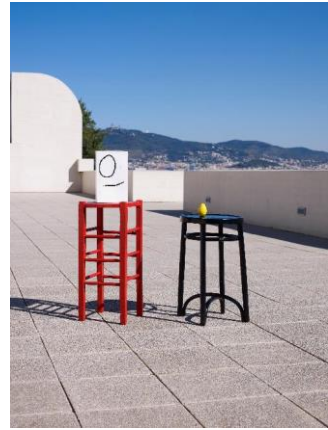
Joaquim Gomis. Retrato de Joan Miró , 1944. Fondo Joaquim Gomis, depositado en el Arxiu Nacional de Catalunya. © Herederos de Joaquim Gomis. Fundació Joan Miró, Barcelona, 2022